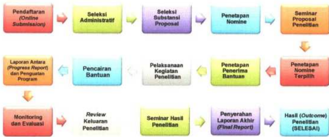
Gambar 4.2: Alur Pengelolaan Bantuan Penelitian Berbasis Standar Biaya Keluaran